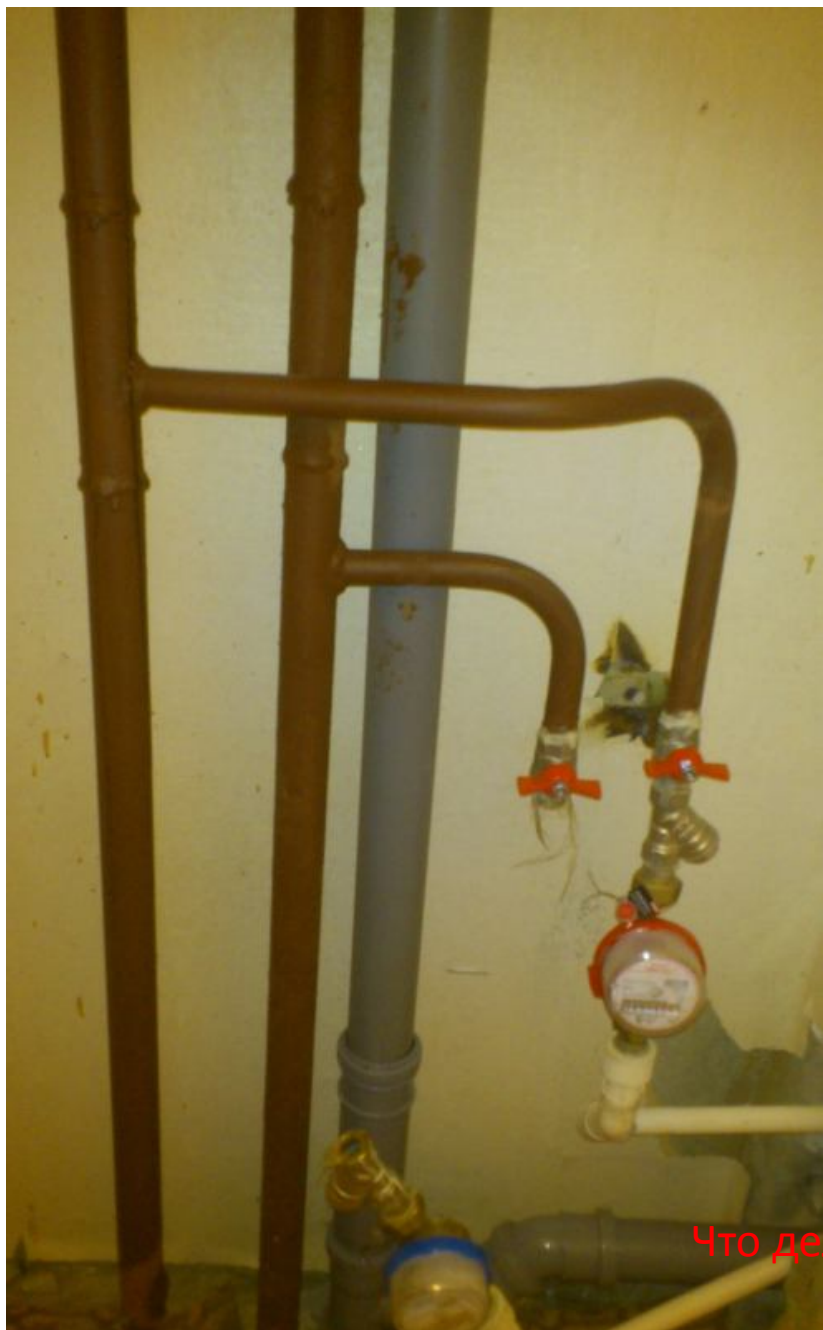
Фото с места аварии – да, кран похож на продукцию VALTEC VT. 218, но это не VALTEC